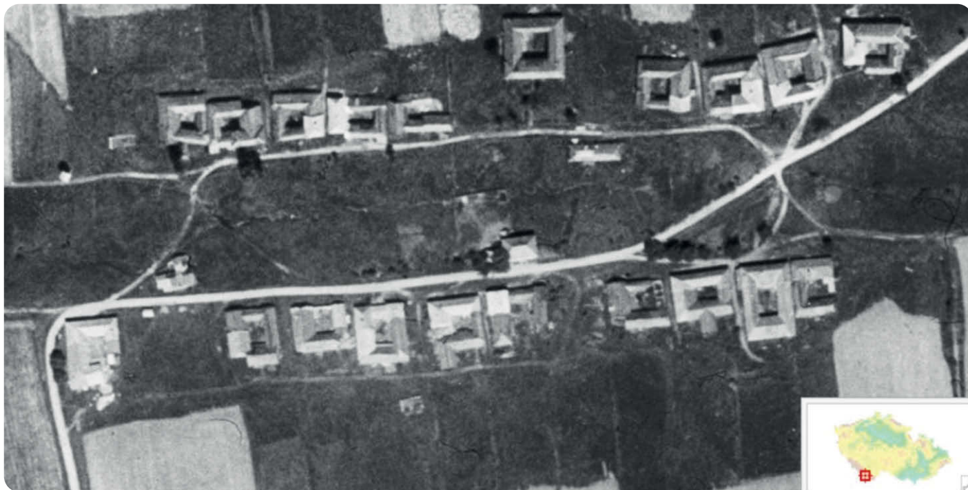
Letecký snímek Blatné z roku 1949

Přiložený letecký snímek Blatné pochází z roku 1949, snad si ještě někdo vzpomene.