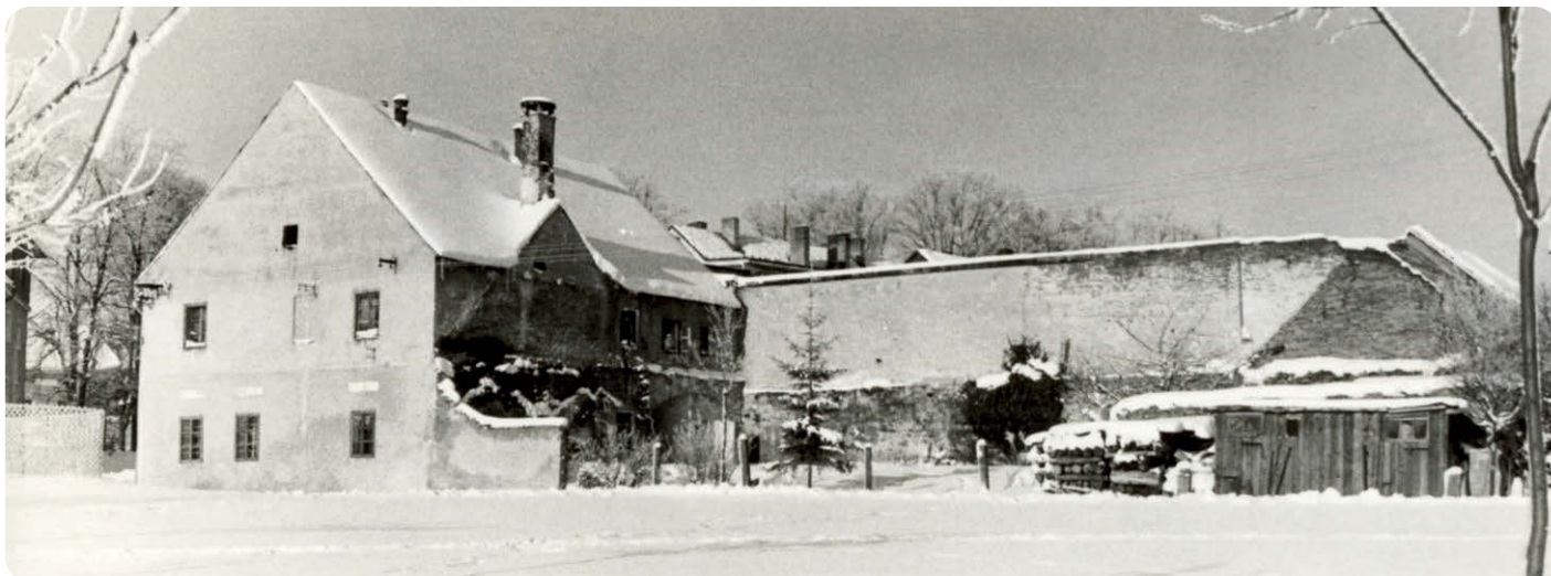
Markusův rodný dům – první doložitelné hnízdiště čápů bílých ve Frymburku.

rodinných okálů na přelomu 70. a 80. let minulého století pod benzínovou stanicí (dnes čp. 128–132). Tehdejší dlouhé lhůty pro dodání „papírové“ nástavby na investorem vybudované zděné přízemí s komínem inspirovalo čápy na položení prvních větví na vrchol minimálně dvou komínů. Dalšího jara se však už z komínů kouřilo a ze zahnízdění tak již nic nebylo.