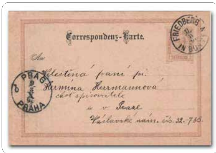
Razítko pošta Frymburk–Praha 8. 8. 1896

během měsíce března na místa určená, a sice do Pláničky 80 kusů, do Milné 100 kusů a do Frymburka 60 kusů.