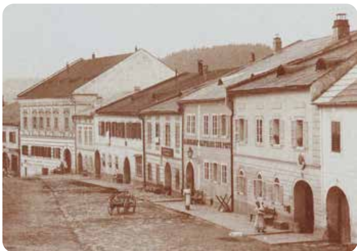
Budova frymburské C.K. pošty čp.79 s poštovní schránkou, vlevo hostinec U pošty.