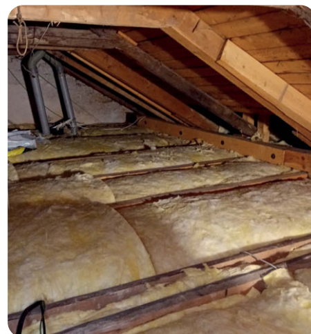
Stav před a po realizaci zateplení