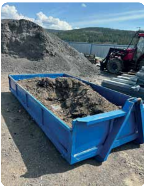
Sběrný dvůr bio odpadu pro občany