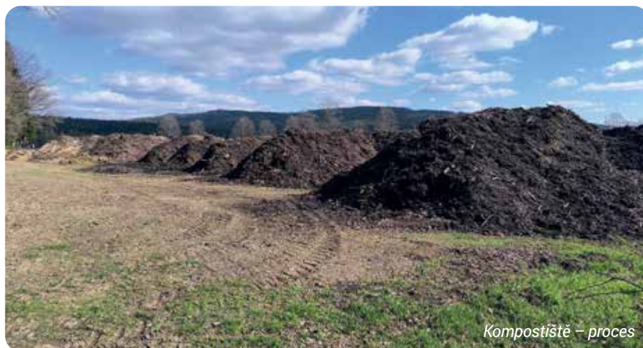
Kompostišťe – proces

My jsme tento materiál sváželi, třídili, zbavovali železa a všeho co nebylo dřevem. Samotné zbylé dřevo jsme prostě pálili a k tomu nám sloužilo stále to v úvodu zmiňované místo, tedy to, kde máme dnes skládku pro bioodpad.