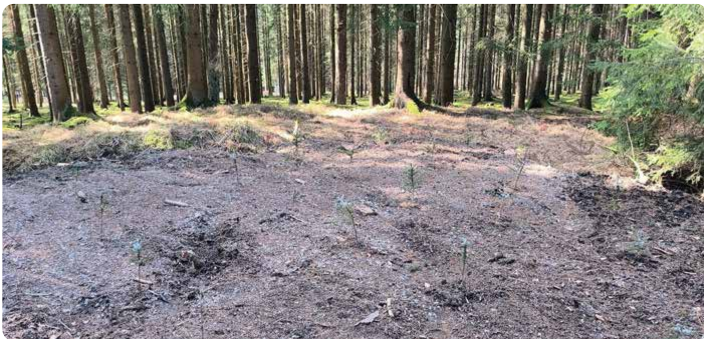
Rekultivovaná plocha s výsadbou mladých jehlíčnanů

norem. Počínaje zákonem o odpadech a konče stavebním zákonem, kdy dokonce dle hmoty a objemu materiálu se někdo domnívá, že je to stavba. Zkráceně, orgány životního prostředí nás kontrolují, orgány České inspekce životního prostředí nás kontrolují, orgány dopravy nás kontrolují a v neposlední řadě orgány činné v trestním řízení (tedy policie a ne ledajaká, ale hospodářská kriminálka) nás kontrolují. Řeknete si a stojí to za to, stojí za to se s tím takto patlat? Jaká je jiná možnost? Koupit si tu službu, nechat si to odvázet a měli bychom klid? To ano, ale my máme současný systém nastavený tak, jak jsem jej popsal. To nám dává obrovskou volnost, svobodu, operativnost a máme na to nastavený celý systém našich technických služeb s jeho zaměstnanci.