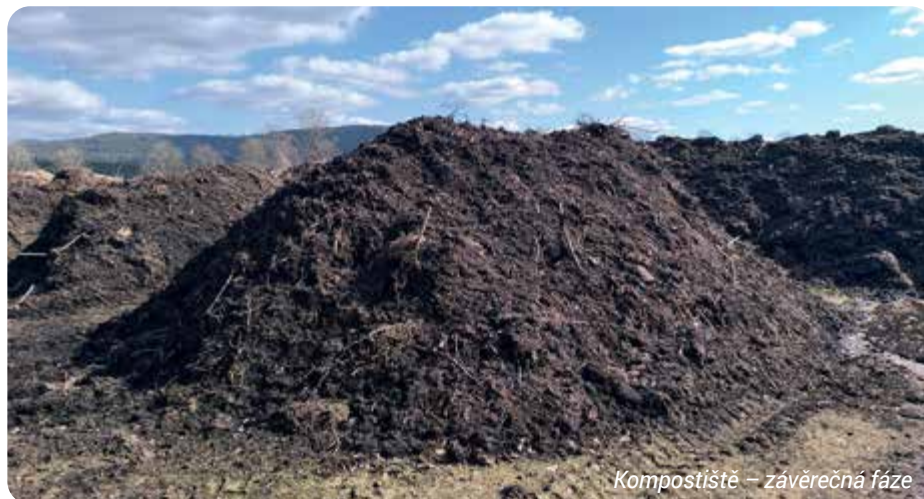
Kompostišťe – závěrečná fáze