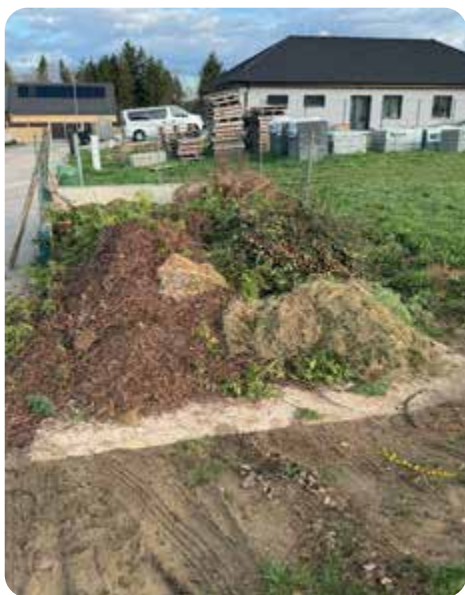
Sběrné místo bio odpadu v obci