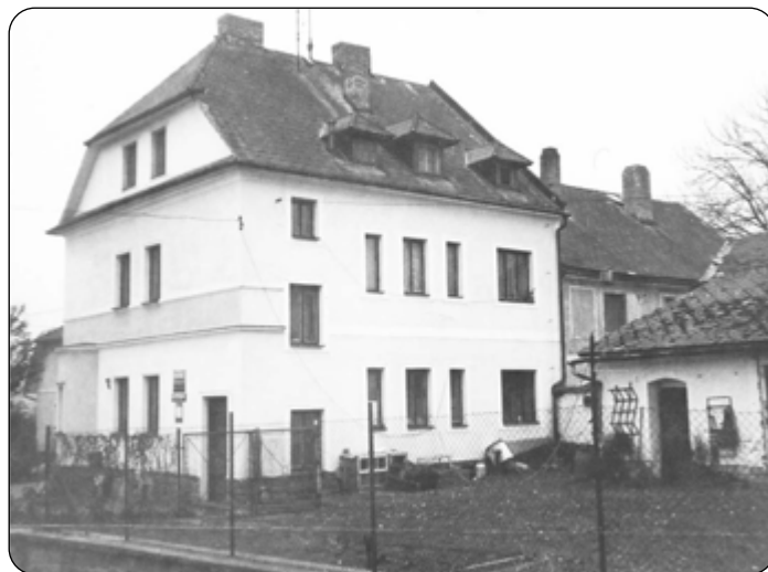
Budova pošty v roce 1991