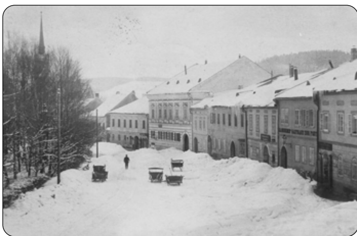
Frymburské náměstí v roce 1908

Pravděpodobně přestěhování souviselo se špatným technickým stavem původní budovy v 50. letech. Tehdy při stavbě přehrad a zátopě cca 1/3 frymburských domů vznikla potřeba zajištění nového bydlení. Kromě zcela nově stavěných domů byly na náměstí zbourány staré zchátralé domy a postaveny nové čp. 6, 9, 24, 25, 77, 79 a 81. Ty už pak sloužily jen jako bytové domy bez doprovodných služeb.