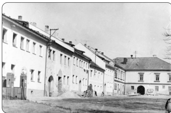
Frymburské náměstí v roce 1959

Rád bych vzpomenul na několik osobností, které po válce na velmi dlouhou dobu spojily svůj život s prací na naší poště a jejich práce se tak stala pro ně vlastně jejich celoživotním posláním.